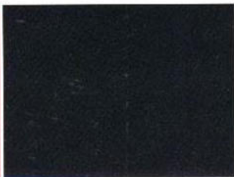
Vulkanschwarz Perleffekt W9