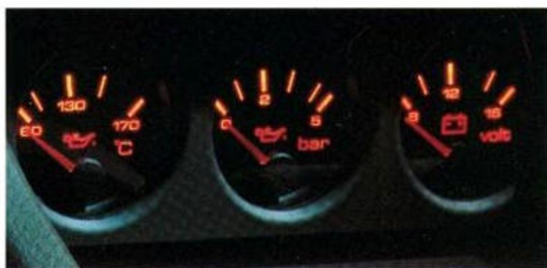
Analoginstrumente für Motoröltemperatur, Öldruck und Batteriespannung