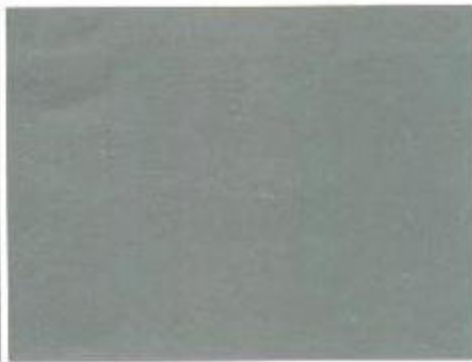
Kristallsilber Metallic C6

Leider können die Farbtöne im Druck nicht so genau wiedergegeben werden wie im Original. Ihr Audi Partner zeigt Ihnen gerne die Originallackmuster.