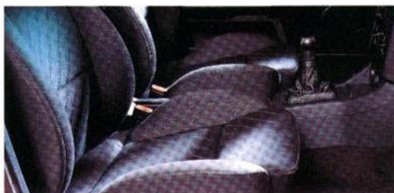
Die vorderen, höhen-einstellbaren Sportsitze sind komfortabel und geben angemessenen Seitenhalt